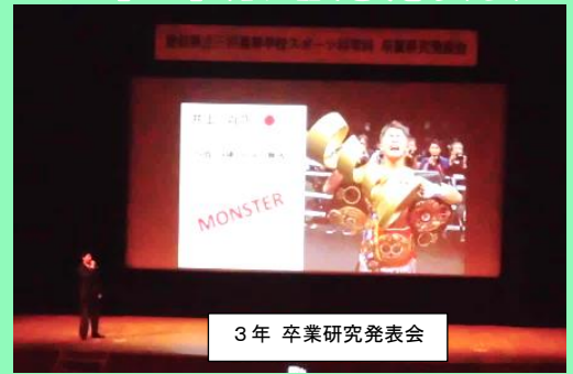
3年 卒業研究発表会

「野外活動」の授業では・・・、 1年生は岐阜県でスキー実習、2年生は沖縄県でスキューバー実習を行いライセンスを取得します。 「オールラウンドな体育・スポーツの指導者を目指す」ために、レジャースポーツの経験を積みました。