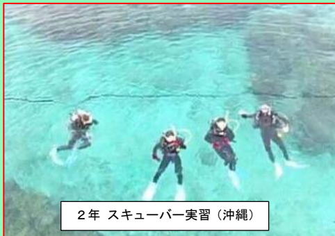
2年 スキューバー実習(沖縄)