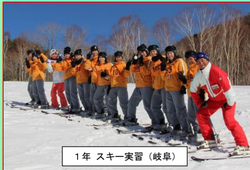
1年 スキー実習(岐阜)