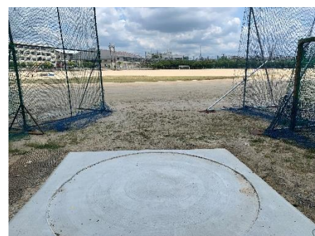
円盤・ハンマー用サークル