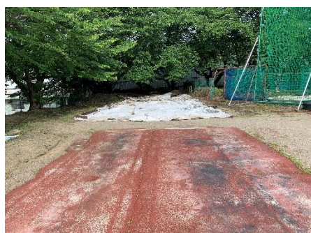
走り幅跳び (タータン2ピット)