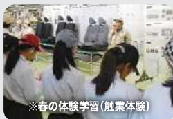
※春の体験学習(触業体験)