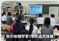
秋の体験学習(学問探究体験)

春・秋・冬の体験学習(輝石体験・学問探究体験)を通して、他者と協働しながら主体的、対話的に課題を見つけ、多角的に探究することによって、問題を解決する能力を培うとともに、自己の適性や進路に対する意識を育てます。