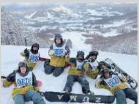
1年生スポ科 雪上実習(菅平高原スキー場)