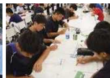
夕食後の学習時間

学校から西方約1300m離れた丘陵地に若樹寮があります。遠距離通学の生徒や集団生活を通して自己の競技力を高めたいと考える希望者に寮が許可されます。現在約150人の生徒が、エアコン完備の2~4人部屋で、規則正しい生活を送っています。パーベキュー会や寮祭、誕生日会などの楽しい企画もあります。