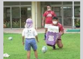
地域連携スポーツ開放講座