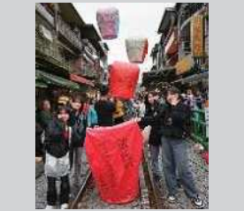
冬の体験学習2年(台湾修学旅行)