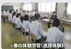
※春の体験学習(進路体験)

春の体験学習では、自己の進路に対する志望理由を明確にし、目標実現までの計画を立て、意欲を喚起します。卒業目前の冬の体験学習では実生活に即した体験を積み重ねることによって、新しい社会に出ていく自覚を養います。