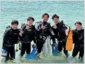
2年生スポ科 水辺実習(沖縄県名護市)